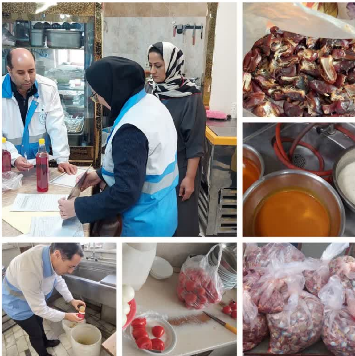
بازدید از سامانه های آبرسانی و کلر سنجی و نمونه برداری از آب آشامیدنی شهری و روستایی