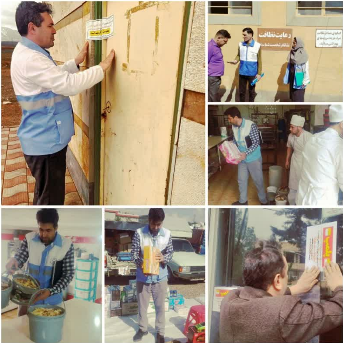
بازدید از اماکن حساس و کنترل بهداشت مواد غذایی و معدوم نمودن مواد غذایی فاسد و غیر مجاز