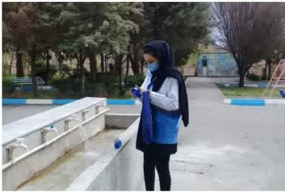
بازدید اکیپ نظارتی مرکز بهداشت استان از روند اجرای برنامه های سلامت نوروزی در شهرستانهای تحت پوشش (اهر و کلیبر سوم فروردین)