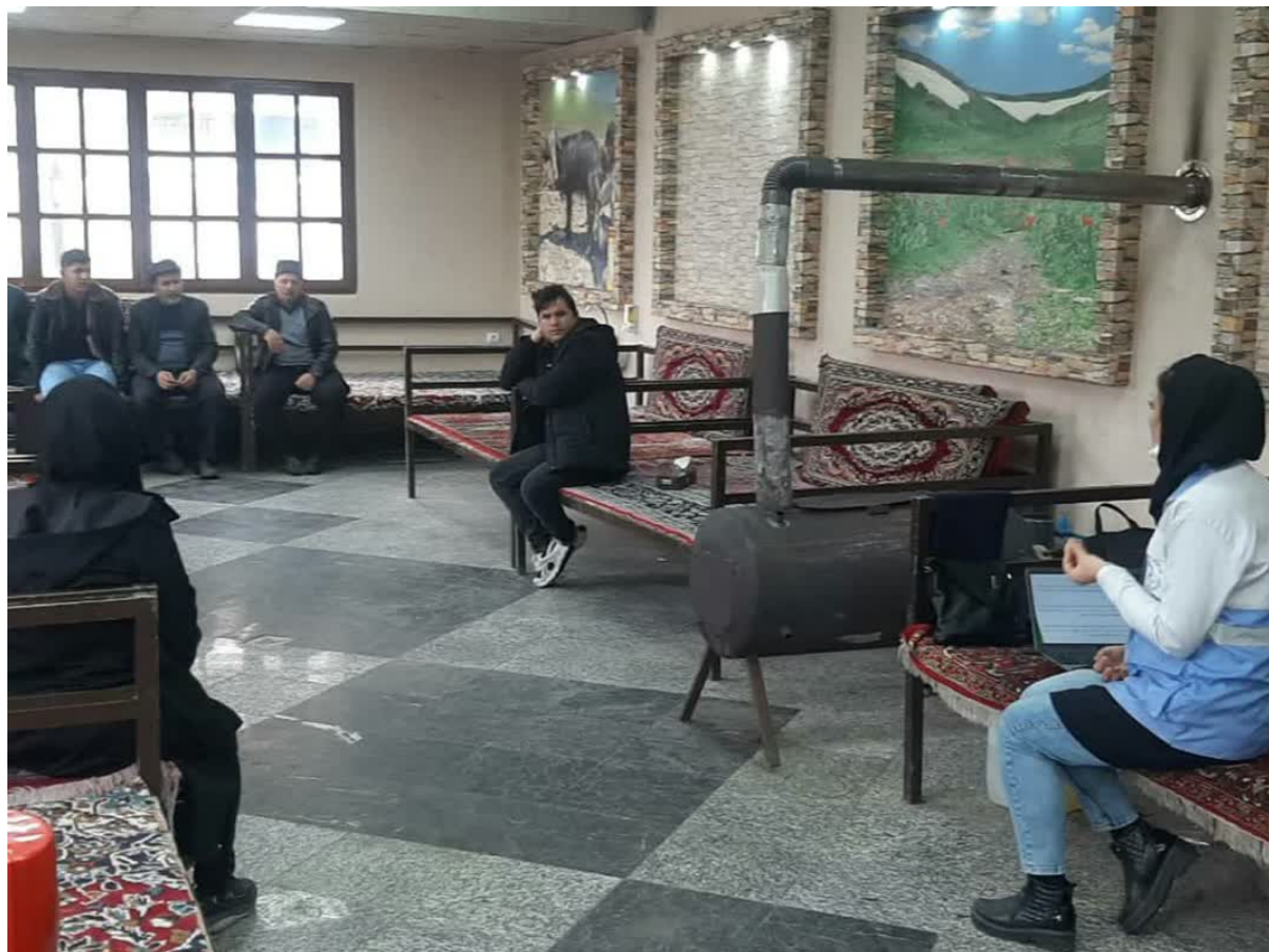
کنترل بهداشت مواد غذایی در مراکز تهیه و توزیع مواد غذایی و توقیف و سنجش با تجهیزات پرتابل و معدوم مواد غذایی غیر قابل مصرف